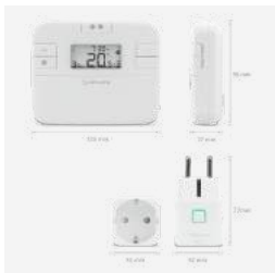
RT510 SPE Programmierbares Funkthermostat + Funkstecker 99 €

Die Batteriebetriebenen Funkraumthermostate können mit einem Funkstecker oder einem Relais verbunden werden.