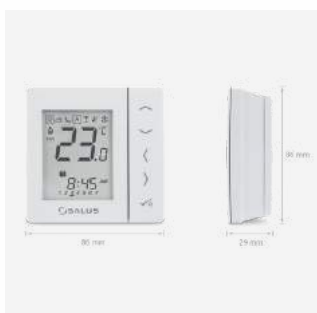
VS20RF Programmierbares Funkthermostat 99 €