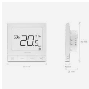
Quantum SQ610 Programmierbares Thermostat, SmartHome kompatibel. 119 €