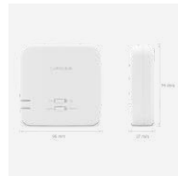
RXRT510 Funkempfänger Aufputz 49 €