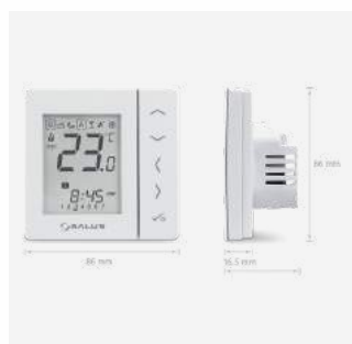
VS10RF Programmierbares Thermostat, kabelgebunden 109 €