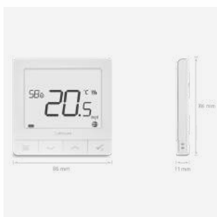
Quantum SQ610RF Programmierbares Funkthermostat mit LI-ION Akku 119 €