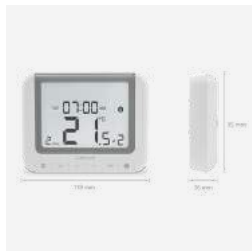
WBRT520TX+ Funkraumthermostat mit extra großem Display 79 €