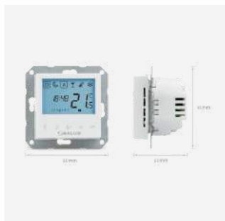
BTRP230 Programmierbares Thermostat für Schalterprogramm 109 €