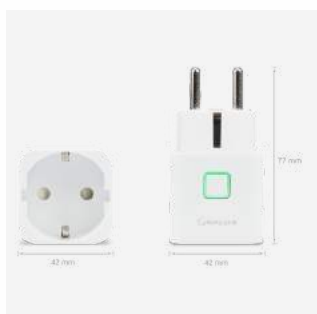
SPE600 Funkstecker 69 €