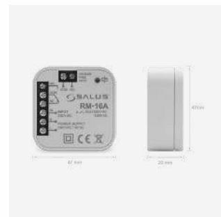
RM-16A Relais 29 €