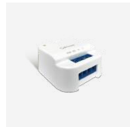
SR868 Funkempfänger Relais 39 €