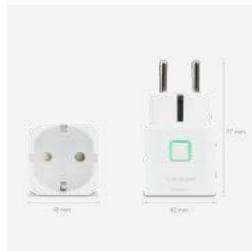
SPE868 Funkempfänger Stecker 59 €