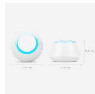
UGE600 Gateway 159 €