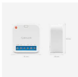
SR600 Relais 69 €