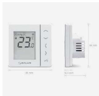
VS30 Programmierbares Thermostat mit Digitalanzeige 69 €